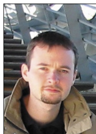
Vážení uživatelé JIB,

dostává se vám do rukou zvláštní číslo informačního zpravodaje, které je věnováno výhradně vylepšené funkcionalitě služby stahování bibliografických záznamů. Je tak určeno především manažerům knihoven, katalogizátorům a akvizitérům a systémovým knihovníkům. S vlastní funkcí stahování záznamů bezprostředně souvisí aktivita, která vyústila ve vyhlášení Profilu Z39.50 JIB, který je nezbytný pro přesné paralelní vyhledávání. O stahování záznamů pojednává první část zpravodaje, za ní následují informace o Profilu Z39.50 JIB. O těchto věcech budeme také hovořit na konferenci Inforum dne 25.5.2004, kde bude vhodná příležitost ukázat vše naživo a odpovědět na vaše případné otázky. Věříme, že tuto vylepšenou službu oceníte a že vám bude při práci přínosem.